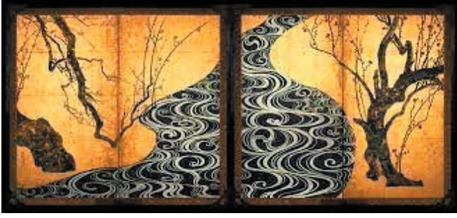
Red and White Plum Blossoms - Wikipedia

2024年3月28日、英国日本人会紅葉会部の3月例会は冷たい雨の中、Farm Street Churchにて35名の会員参加で行われました(13:00-16:00)。気温は11℃、お食事/後片付け(13:00-13:40)の後、今回の講演テーマは「ウエルビーイングな生き方を探る—文化と自己—」(14:00-15:30)。